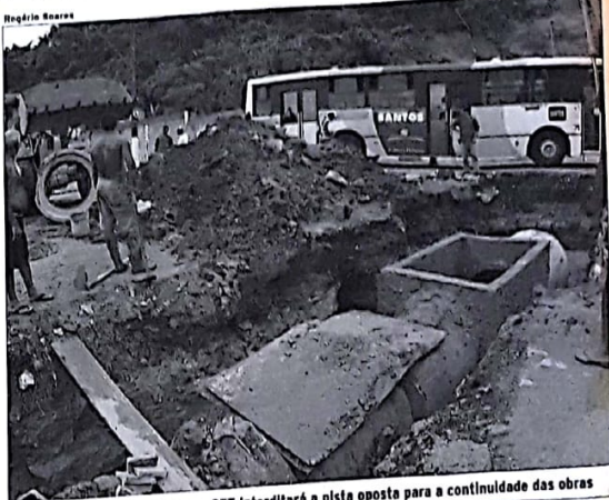
No próximo final de semana, a CET interditará a pista oposta para a continuidade das obras