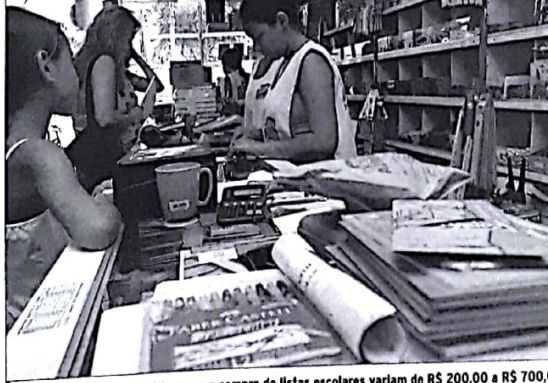
Linhas de crédito oferecidas para a compra de listas escolares variam de R$ 200,00 a R$ 700,00

Para aliviar o orçamento dos pais e facilitar a compra do material escolar, bancos já oferecem linhas de crédito específicas. A Nossa Caixa está financiando até R$ 200,00 e R$ 700,00 para pais adquirem a lista escolar dos filhos. Para obter o financiamento é necessário ser correntista da Caixa. Os requisitos obrigatórios incluem a comprovação de renda compatível com o emprego, estar empregado e não ter restrições bancárias. Os interessados devem, ainda, apresentar toda a relação de compra do orçamento do material escolar, além dos originais dos recibos pessoais. O banco oferece prazo de até dois meses e um valor para as linhas que não ultrapassam os R$ 700,00. As taxas de juros são de 3,95% ao mês para correntistas e 4,70% para não-clientes, que precisam como garantia cheques pessoais. A linha de crédito é uma modalidade de serviço para famílias com mais de um filho matriculado em escola. O financiamento específico porque as parcelas não conseguem dividir o valor em muitas vezes”, afirma a gerente-adjunta